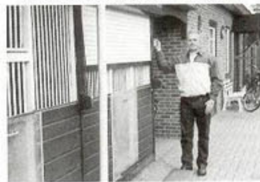
Zo werkt het systeem met de rolluiken.

de vlucht terugzien gaan ze vaak snavelen en in de mand kan via de snavel een besmetting zijn opgedaan.