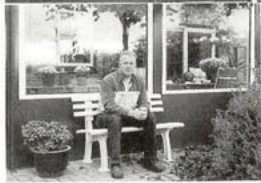
Bij mooi weer worden de duiven hier opgewacht.