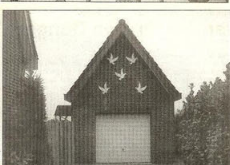
● Op de oprit was al te zien dat dit wel het goede adres moest zijn.

- 6 Hannut - 2.457 duiven: 9, 44, 91, 161, 182, 226, 304, 413, 418, 419 enz. (26 mee - 12 pr.) 9 - 6 Houding - 2.729 duiven: 1, 4, 13, 24, 25, 61, 77, 78, 86, 87, 99 enz. (26 mee - 21 pr.) 16 - 6 Nijvel - 2.272 duiven: 2, 8, 11, 12, 14, 56, 66, 68, 70, 75 enz. (22 mee - 16 pr.) 23 - 6 Rethel - 2.164 duiven: 5, 11, 32, 91, 126, 127, 130, 157, 191, 228, enz. (20 mee - 13 pr.) 30 - 6 St. Ghislain - 1.958 duiven: 20, 22, 39, 55, 96, 110, 137, 138, 164, 189 enz. (20 mee - 13 pr.)