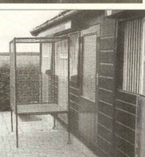
● De verrijdbare ren.