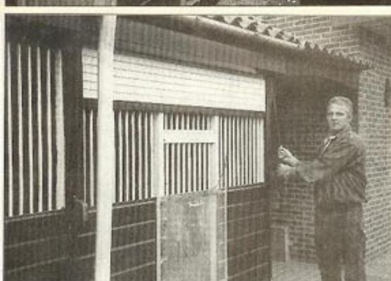
● Zo werkt het systeem met de rolluiken.

duwschap voor doffers en duivinnen met 16 doffers en 16 duivinnen. De koppeling vindt plaats direct na de verenigingstentoonstelling aan het eind van december. Uit de beste vliegers wordt één ronde gekweekt. Van de kwekers